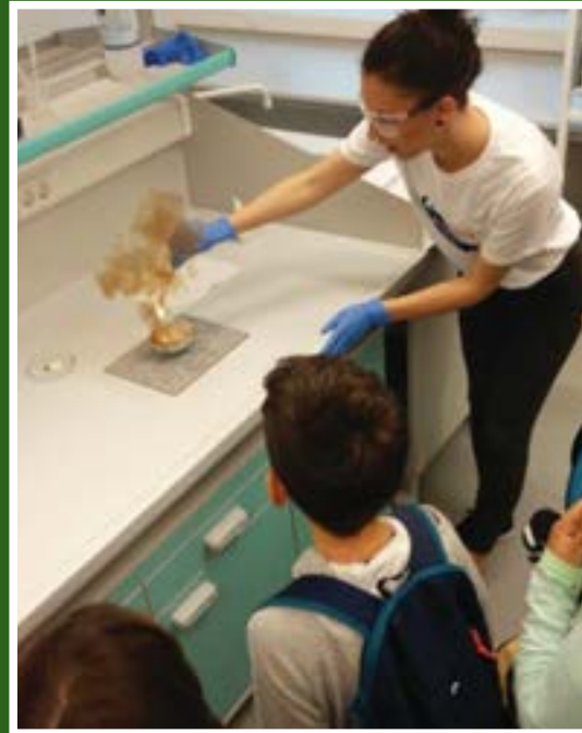
Radionica „Znanost može biti zabavna!”