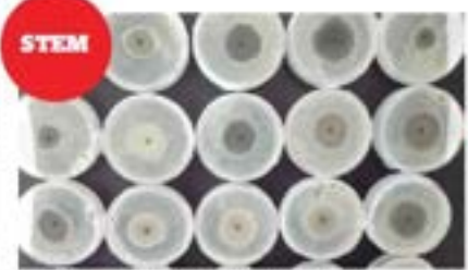
Mjerenje - usporedba Macrophomina phaseolina

tekućine kroz otvore na dorzalnoj strani tijela. Celomska tekućina ima ulogu u obrani organizama od predatora, ali i ulogu u zaštiti od različitih patogena. Celomska tekućina gujavica sadrži celomocite - imunološke stanice, ali i druge biološki aktivne tvari s antimikrobnim svojstvima. Ekstrakt celomske tekućine gujavica uzrokuje inhibiciju rasta fitopatogenih gljiva, a cilj je ovog projekta istražiti utjecaj celomocita gujavica na rast zemljišnih fitopatogenih gljiva koje su prisutne u našim tlima te utvrditi mehanizam te interakcije.