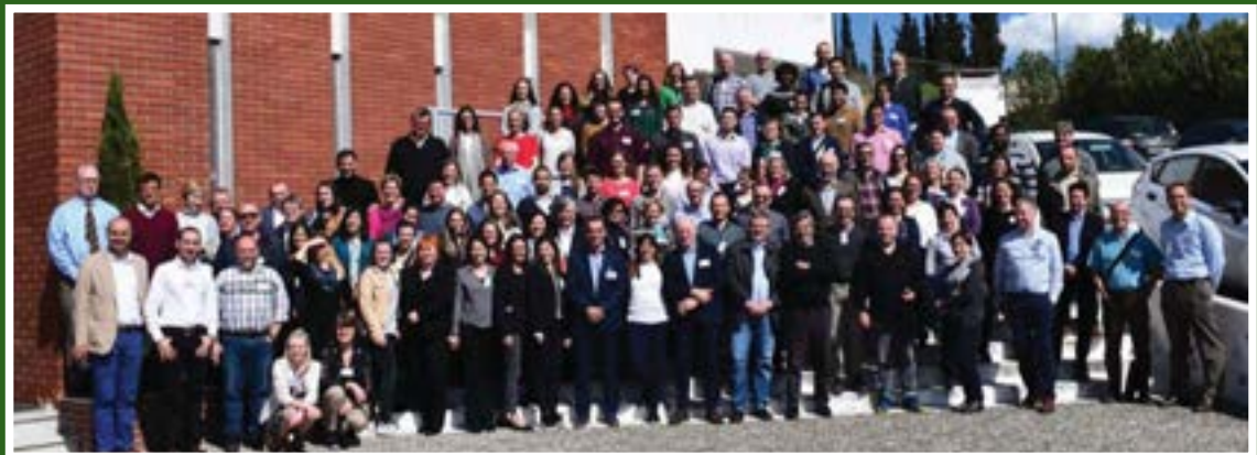
Članovi Zavoda za stočarstvo na Fifth DairyCare conference 2018. 19th and 20th March 2018. Thessaloniki (Greece)