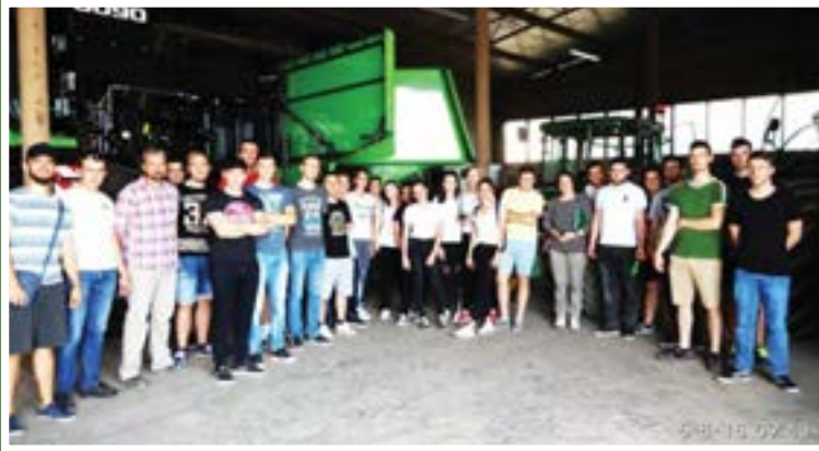
◀ Studenti druge godine Sveučilišnog preddiplomskog studija smjera Bilinogojstvo na terenskoj nastavi na Zavodu za sjemenarstvo i rasadnicarstvo u Osijeku