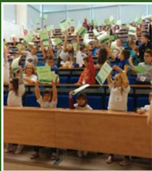
Dodjela „diplomica“ na promociji