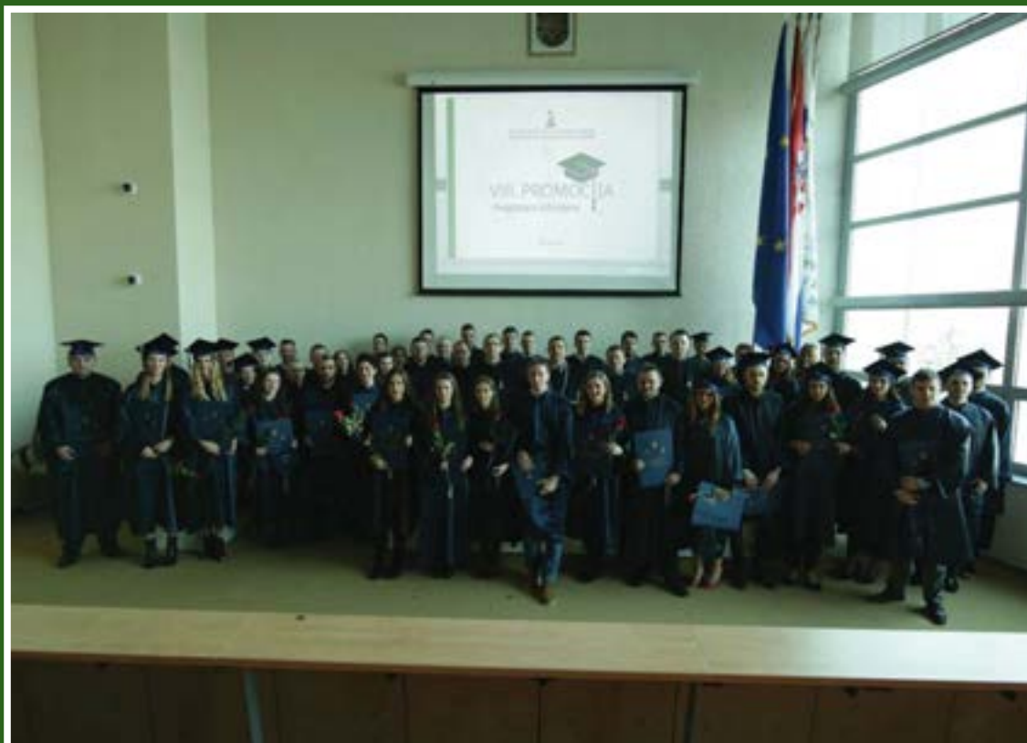
VIII. promocija magistara inženjera, siječanj 2018.