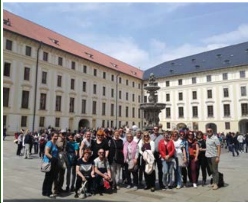
Posjet djelatnika FAZOSa Pragu