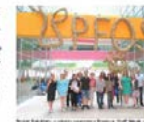
Proje Fakulteta u okviru programa Suradnja sa Sveučilištem u Osijeku u lipnju 2018.

U skladu sa zadanim ciljevima projekta u okviru ovog istraživanja nastavlja se razvijati kao jedna od ključnih sastavnica Sveučilišta u Osijeku.