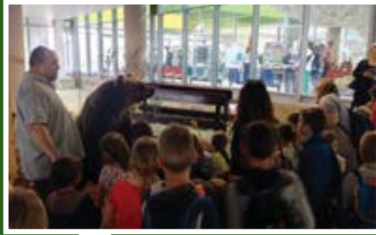
Instalacija „Medo otkriva med i ribu”