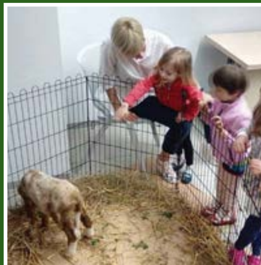
Radionica „Dobrodošli na Nojnu arku!”