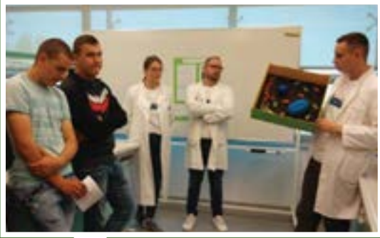
Radionica „Otkrijmo biljnu stanicu zajedno!”