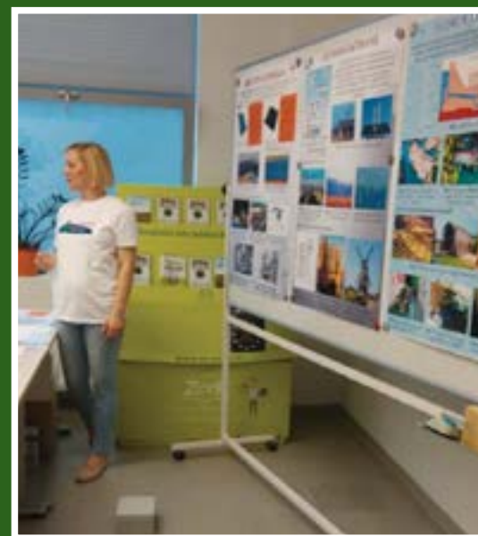
Radionica „Počeci korištenja obnovljivih izvora energije“