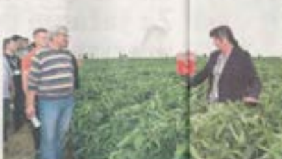
Obilazak prvih dana polja durav soja u Hibitskoj

Poljoprivredna proizvodnja Poljoprivredna proizvodnja u Hrvatskoj, Sloveniji i Srbiji, u okviru projekta Erasmus+ Staff Weeka, u Opatovcu održava predavanja i obilazke u poljoprivrednim gospodarstvima.