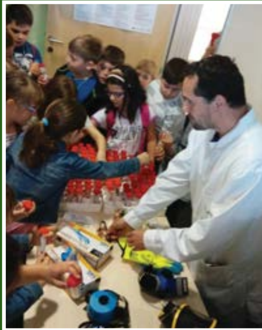
Radionica „Labos i njegovi istraživači”