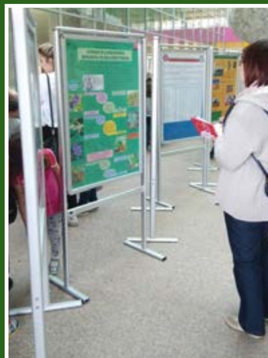
Izložba postera u glavnom hodniku Poljoprivrednog fakulteta u Osijeku